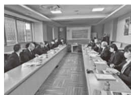
説明を聞く環境・福祉委員会のメンバー

このような行政の取り組みの中で、経済団体・事業者として脱炭素社会を目指し、共に取り組んでいく必要性を認識する機会となりました。