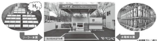
エス・バード近隣に水素ステーションを設置し、南信州地域に水素を供給