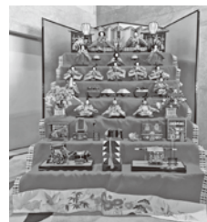
シルクホテルアネックス 7段飾りの雛人形