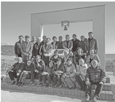
恋人岬にて記念撮影