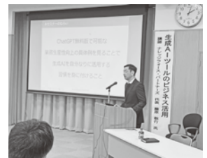
生成AI活用の具体例を説明

ChatGPTを使いどのようなプロンプト（質問）を出せば、望んだ回答が得られるかを、実際の操作を見せながら説明をしたことで「文書作成等の過程が分かった」「明日から早速試してみたい」といった感想も寄せられました。当所では今後もこのようなIT関連のセミナーを開催します。現在、様々な場面でデジタル化の進展が加速しており、事業者がなかなか対応できない状況ですが、ぜひセミナーに参加していただきITツールを正しく理解し業務効率化や生産性向上に繋げてください。