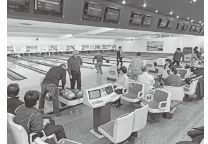
プレーを楽しみながら交流