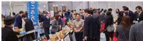
熱気溢れる会場の様子

この商談会は長野県産業振興機構が主催し、例年6月と1月に開催されている展示商談会です。飯田地域からは4者が参加し、南信地域全体では9者が参加しました。バイヤーと支援機関の関係者は135名が来場し、多くの商談が行われました。