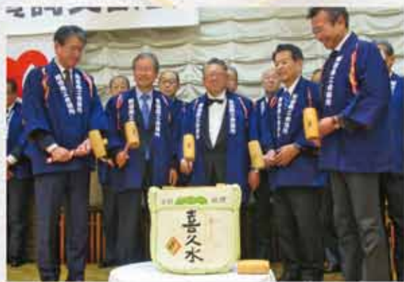
地域の発展を願っての鏡開き