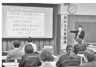
新聞の伝える工夫を学ぶ

参加者からは、「他の方の意見が聞いて良かった」「これからの業務に活かしていきたい」といった感想があり、実践的でスキルアップにつながる機会となりました。