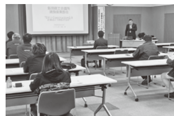
DX推進のポイントを学ぶ

参加者からは、「より早い対応が必要になると感じたので、自社でも検討を深めていきたい」「自社の取り組みと比べてより進んだ話を聞けて刺激になった」といった感想が聞かれ、DX化の第一歩となるセミナーとなりました。