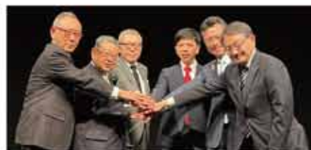
三地域の更なる連携を確認

分科会、全体会の内容は特設サイトで動画視聴ができます。次回は今年の10月に飯田市で開催予定です。