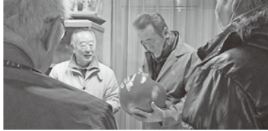
全員でだるまに目を入れる

松尾支部を代表して正副支部長が鳩ヶ嶺八幡宮へ参拝し御札をいただき、集まった役員が松尾商工会館の神棚にむかい、商売繁盛と松尾地区の繁栄を祈願しました。御神酒をいただきダルマに目を入れた後、場所をチキン亭に移して新年会を開催しました。